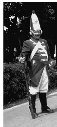
Uniformen der Bürgerwehr und Landwehr