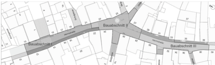
Abb.: Bauabschnitte 1-3 der Neugestaltungsmaßnahme „Herrnsstraße Mitte“

Für die Anlieger besteht die Möglichkeit, bei Bedarf Abdichtungs- oder Verputzarbeiten an den direkt angrenzenden Außenwänden (im Straßenkoffer ca. 50 cm unterhalb der bestehenden/neuen Geländeoberfläche), in Eigenregie (d.h. durch eigene Beauftragung einer Fachfirma oder Eigenleistung) und auf eigene Kosten, auszuführen. Von Seiten der Stadt Mainbernheim können hierfür keine Kosten übernommen werden.