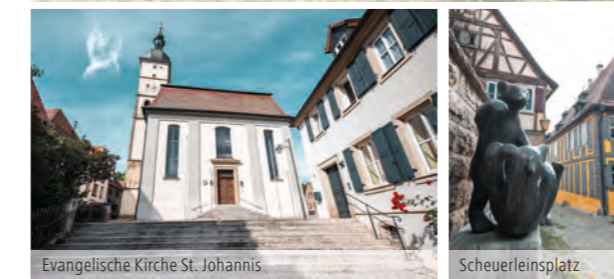
Evangelische Kirche St. Johannes